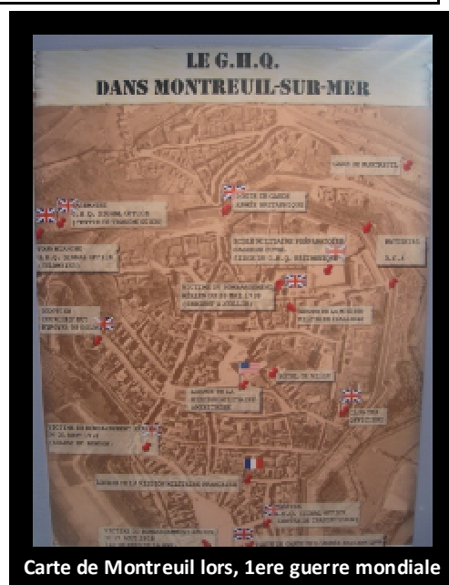
Carte de Montreuil lors, 1ere guerre mondiale

En général, pour chaque élève le séjour a été enrichissant et très plaisant. Ce qui a également permis de souder le groupe.