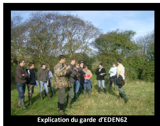
Explication du garde d'EDEN62

La journée Lilloise : Mercredi, les élèves sont allés au musée des beaux arts de Lille où ils ont appris comment lire une image. Ainsi qu'à comprendre la signification des couleurs dans une œuvre. L'après-midi se déroula au musée d'histoire naturelle. Un guide donna aux élèves des explications sur l'évolution des espèces. Puis les lycéens ont pu observer des spécimens disparus. Le soir venu, les étudiants ont été soupés à « La Baignoire » une brasserie Lilloise ils s'y sont régalés. Puis ils ont fini la soirée au « Latina » (dommage que M.GAMBART et Mme. FATOUX n'aient pas dansé la salsa)